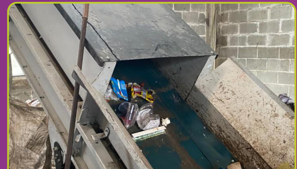
Esteira de saída