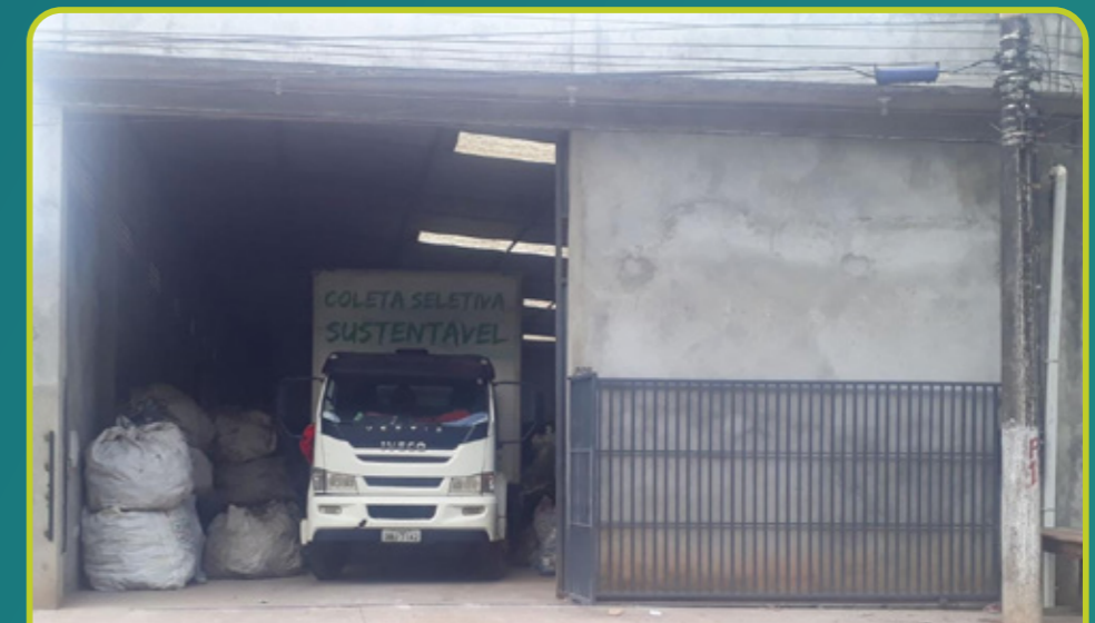
Aluguel do galpão