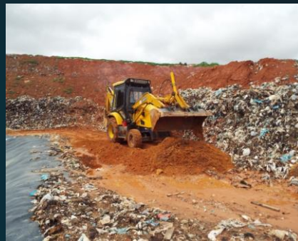
Teresina - CTA