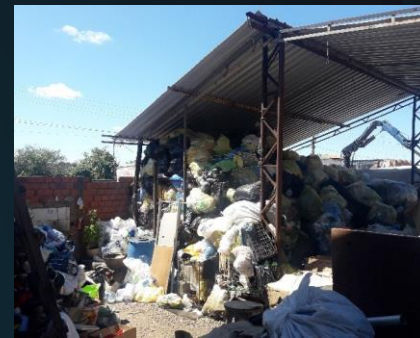
Teresina – Emaús