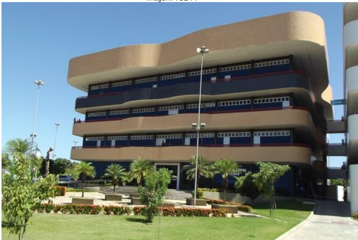
Tribunal de Contas do Estado do Piauí

Vale ressaltar que estudantes que já pertencem ao quadro de servidores do TCE não podem concorrer, assim como aqueles que são parentes até o terceiro grau de membros da comissão de elaboração do teste seletivo, que está sob a responsabilidade da Escola de Gestão e Controle (EGC) do órgão.