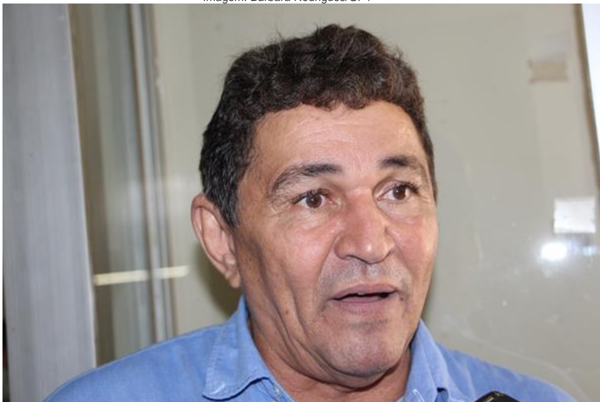
Lázaro do Piauí

A recomendação é para que na contratação de profissionais do setor artístico por inexigibilidade de licitação, atentar para a comprovação nos autos de que o contratado é consagrado pela crítica especializada ou pela opinião pública, o que pode ser feito por meio de peças que comprovem a participação recente e anterior do profissional do setor artístico contratado em outros espetáculos de alcance similar, como recortes de jornais de imprensa reconhecidos, resenhas de críticas devidamente publicadas, histórico de performances recentes em outras localidades, entre outros pontos.