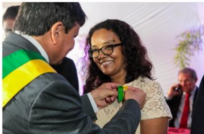
Solenidade de Outorga da Ordem Estadual do Mérito Renascença do Piauí

Em alusão a uma das datas decisivas no processo da independência do Piauí, o Governo do Estado promove a solenidade de Outorga da Ordem Estadual do Mérito Renascença do Piauí. O evento reconhece oficialmente a contribuição de dezenas de piauienses para o progresso do Estado e condecora os escolhidos por meio de comendas. Em Teresina a cerimônia será realizada nesta quarta-feira (19), às 19h, no Complexo Cultural Theatro 4 de Setembro, centro da capital.