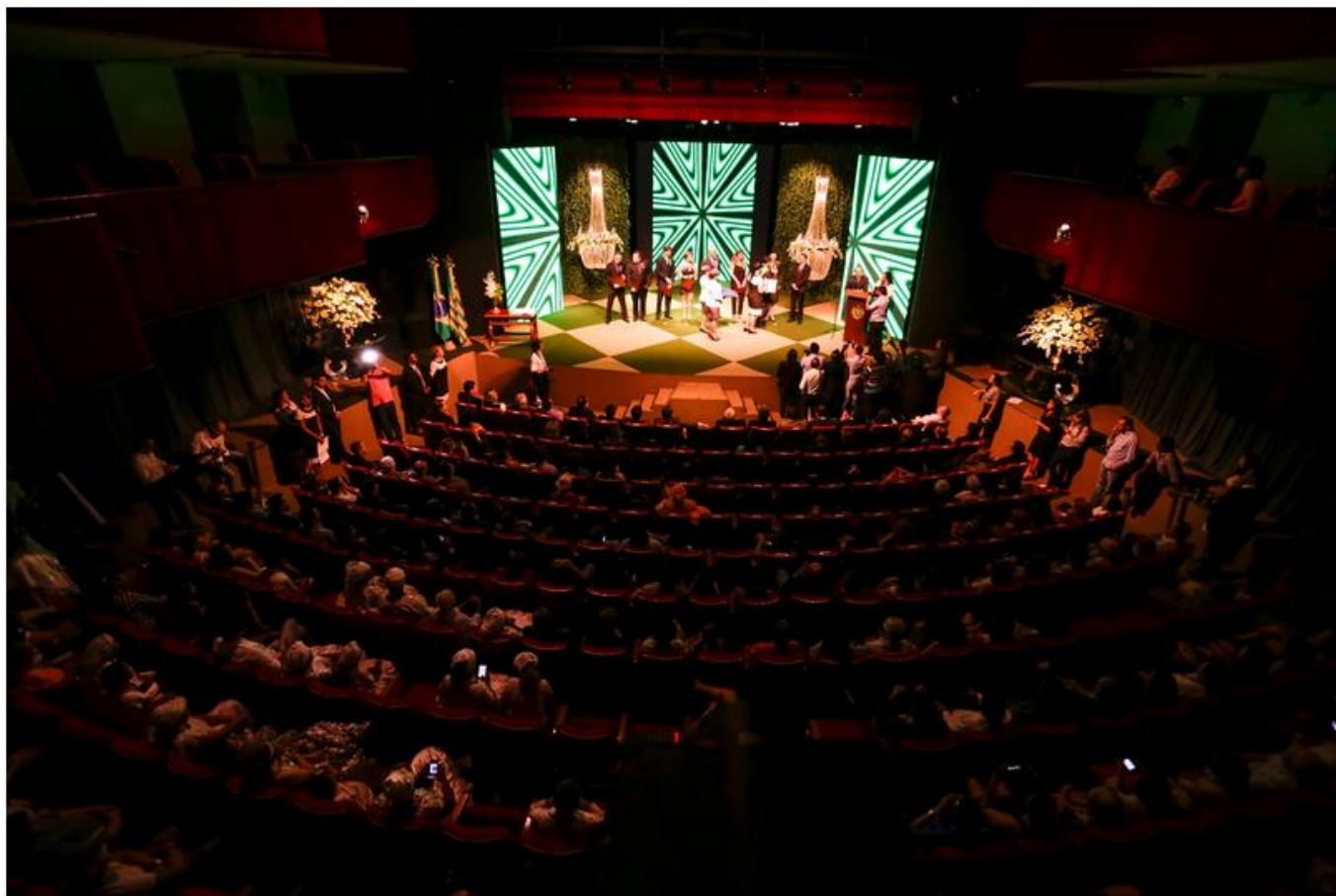
Evento foi realizado no Theatro 4 de Setembro

Um dos agraciados foi o procurador-geral do Ministério Público de Contas, Plínio Valente. “Com certeza é uma satisfação e alegria receber essa medalha e no dia do Piauí, que é o meu estado, para mim é uma grande honra”, afirmou ao GP1 . Ao todo, 28 personalidades e entidades foram agraciadas com as comendas.