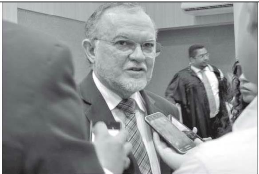
O CONSELHEIRO Olavo Rebelo é eleito por unanimidade para a presidência do Tribunal de Contas do Estado