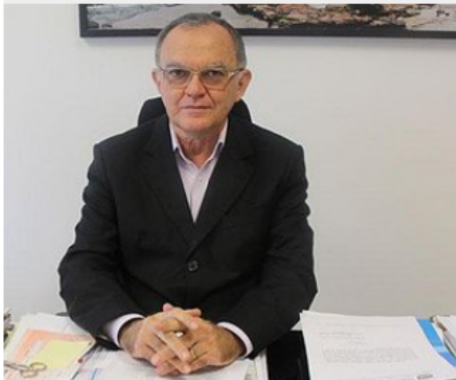
Novo presidente do TCE-PI, Olavo Rebelo

TERESINA - O conselheiro Olavo Rebelo foi escolhido por unanimidade como o novo presidente do Tribunal de Contas do Estado do Piauí (TCE-PI) . A decisão se deu em consenso entre os sete conselheiros. Ele comandará a Casa pelo próximo biênio.