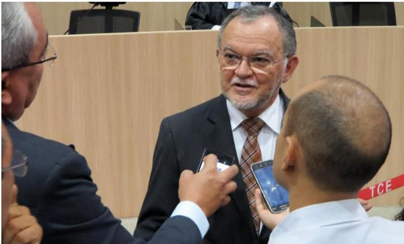
Conselheiro Olavo Rebelo é eleito novo presidente do TCE-PI