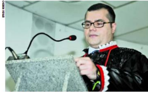
PLÍNIO VALENTE fala ao assumir comando do Ministério Público de Contas

"Culturalmente, as nossas gestões em todo o Brasil não davam uma importância muito grande às Leis Orçamentárias, especialmente nos municípios e no Estado. Não só no Piauí, mas em todo o Brasil. Penso que toda essa discussão vai aumentar o número de doutrinas, jurisprudência e deverá