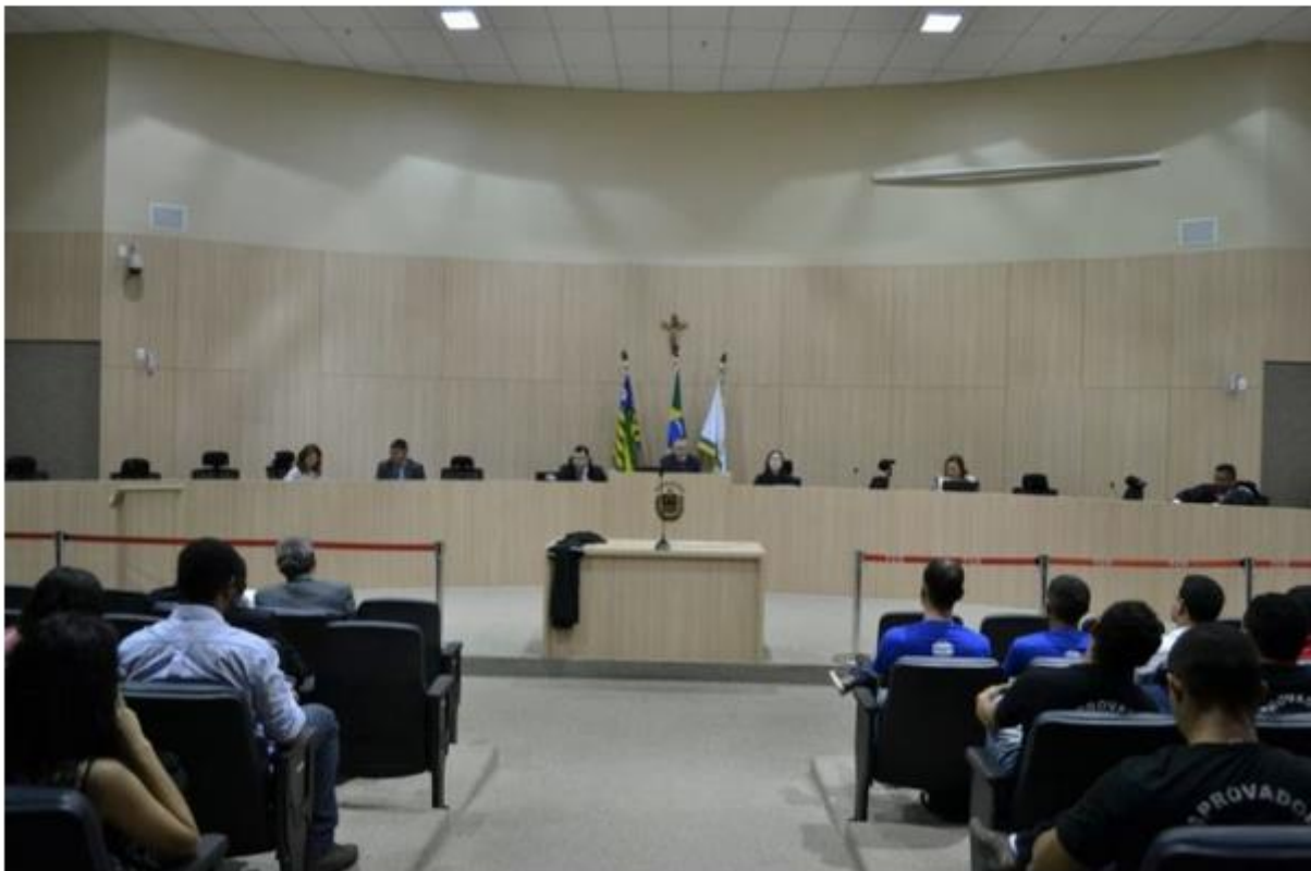
TCE discute a convocação e nomeação de concursados da Guarda Municipal