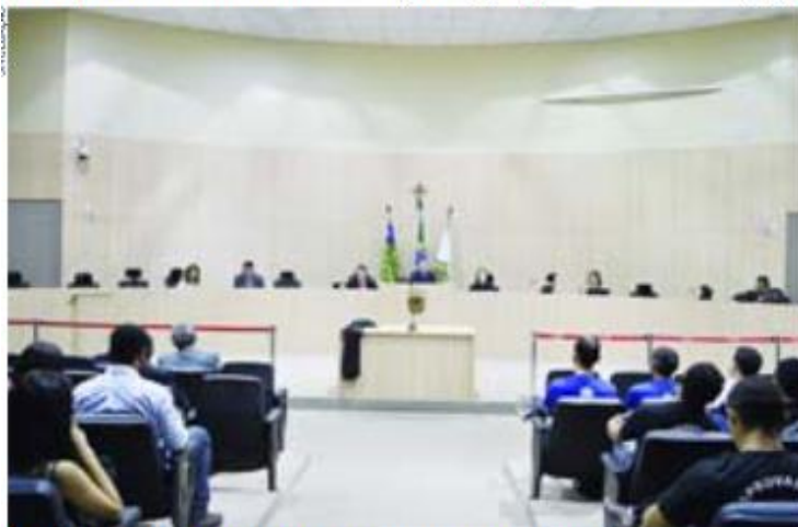
O PRAZO sugerido para a elaboração é de quinze dias