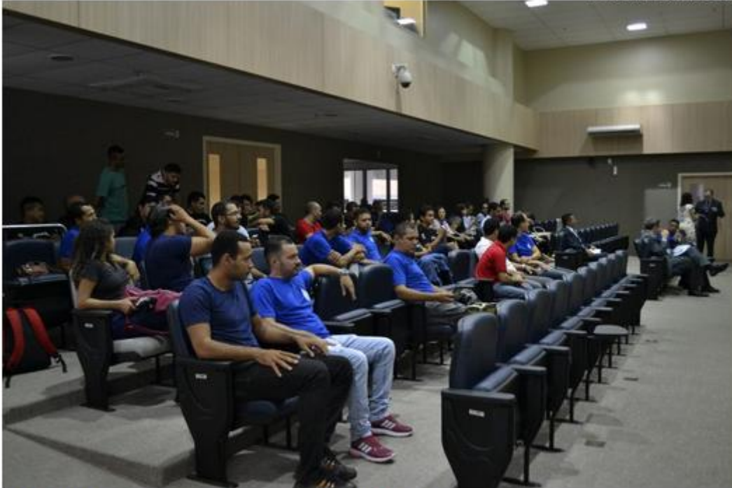
Audiência Pública realizada nesta segunda-feira (12), no Tribunal de Contas do Piauí.

O concurso público para a Guarda Municipal de Teresina foi realizado no final de 2015. Segundo a Prefeitura, 120 das 230 vagas disponíveis foram preenchidas.