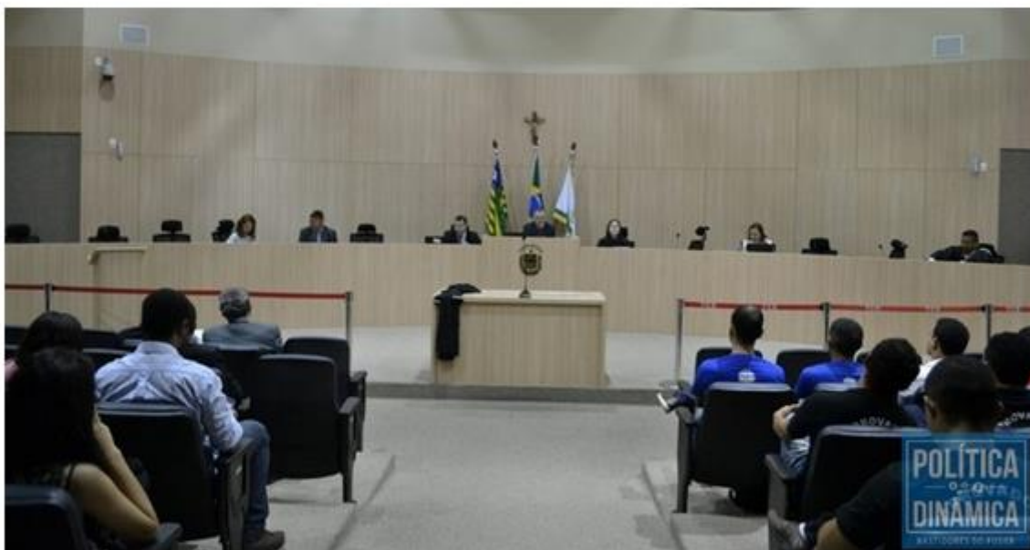
Decisão sobre a demora na convocação chega ao TCE