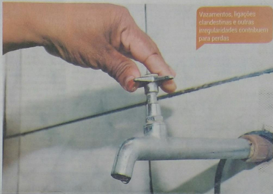
Vazamentos, ligações clandestinas e outras irregularidades contribuem para perdas

Em janeiro de 2016, com o objetivo de resolver esse problema, o Governo do Estado do Piauí lançou edital de licitação para escolha de empresa responsável por gerir os sistemas de abastecimento d'água e esgotamento sanitário de Teresina. A empresa vencedora do certame ficará responsável pelos serviços por 31 anos, devendo investir R$ 1,7 bilhão em esgotamento e abastecimento d'água na capital. No momento, o processo de subconcessão dos serviços de abastecimento d'água e es-