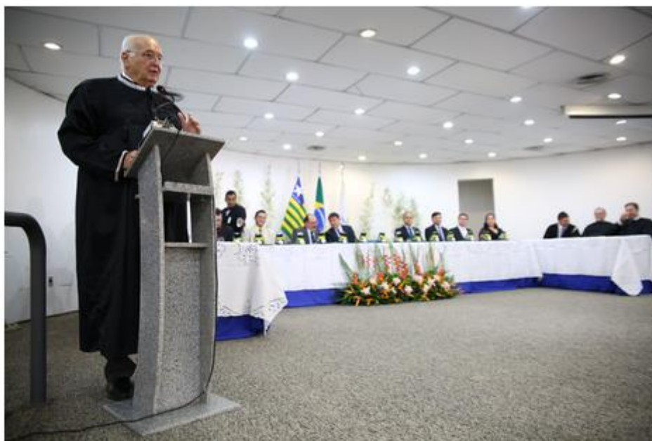
Conselheiro Luciano Nunes

O ex-presidente do Tribunal de Contas do Estado (TCE-PI), conselheiro Luciano Nunes, foi submetido a um cateterismo no final da manhã desta terça-feira (14). Depois de realizar uma avaliação coronariana em Nunes, os médicos agendaram o procedimento para ser realizado hoje no Hospital HTI Sul, em Teresina.