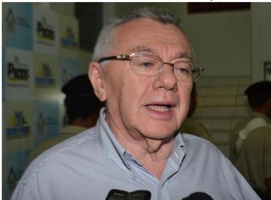
Prefeito de Picos, Kléber Eulálio (PMDB)

De acordo com Kléber Eulálio, o trabalho para obter votos está sendo feito através de visitas aos deputados. "Estou visitando os deputados, pedindo o apoio deles, e estou satisfeito com essas visitas", afirmou.