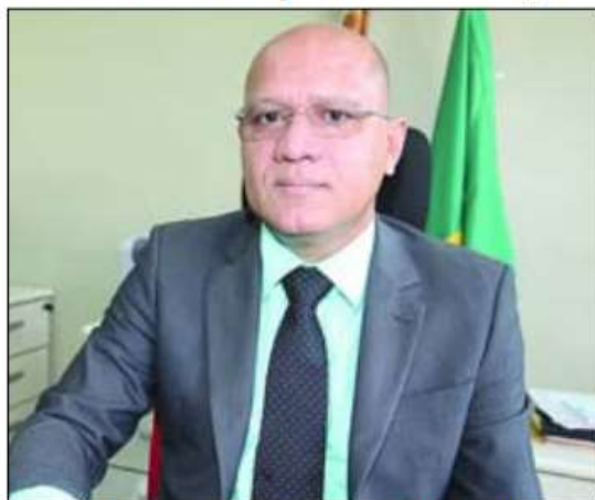
FRANZÉ | Secretário espera dados do balanço quadrimestral

CONVOCAÇÃO – No tocante a contratação de pessoal, o governador Wellington Dias (PT) esclareceu as dúvidas sobre a convocação de concursados em diversas