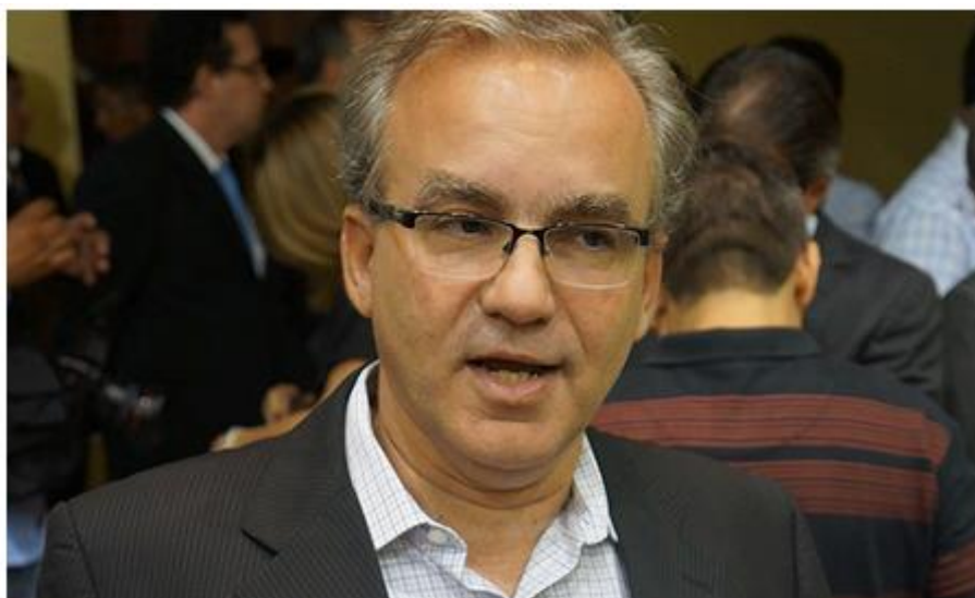
Entre 2011 e 2013 a empresa recebeu pagamentos na ordem de R$ 136 milhões

Dentre as irregularidades encontradas pelos auditores do TCE-PI, estão: dados contábeis apócrifos (sem validade jurídica), ausência de comprovante de publicação de aviso de licitação e da decisão da sessão de entrega da abertura dos licitantes, alteração no critério de reajuste de preços inicialmente previsto na minuta do contrato, recusa de fornecimento do edital e da participação de empresa interessada (nove outras empresas foram impedidas de participar), competitividade prejudicada, ausência de comprovação de execução do item sobre Programa de Educação Ambiental e operação de unidades de triagem e resíduos recicláveis.