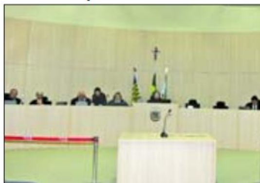
JULGAMENTO | Conselheiros julgaram bloqueio de contas

Ficou decidido também que os gestores que contrataram com a Norte Sul Alimentos serão notificados pelo Tribunal para a suspensão de todos os pagamentos referentes aos contratos e apresen-