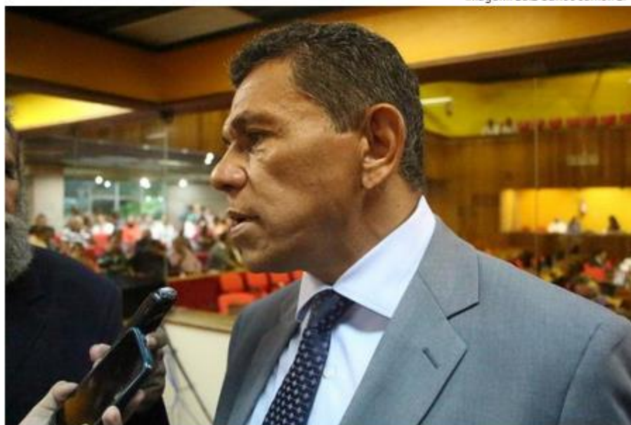
Deputado João de Deus

"Nós vamos aguardar primeiro o encerramento das inscrições e então, acho que cabe a gente sentar e ver quem são os nomes, sentar com a bancada e buscar o entendimento", afirmou.